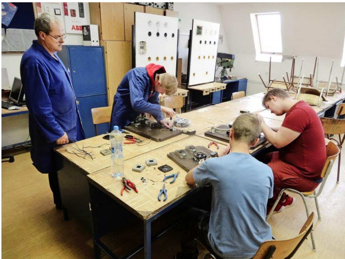
Veľký záujem žiakov je nielen o strojársku, ale aj elektrotechnické odbory.